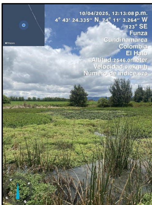
Ilustración 4. Evidencia recorrido punto 3.

C.P. 250020 Tel. +57(1) 823 40 70 823 40 71 / 823 40 73 Fax. + 57(1) 825 76 20 Dir. Cra. 14 No. 13-05