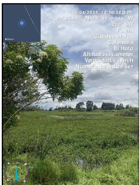
Ilustración 2. Evidencia recorrido punto 1

Dentro del recorrido de control y vigilancia no se evidenció presencia de residuos, motobombas, ni semovientes que puedan afectar al ecosistema, ni actividades que alteren el entorno natural o la calidad del agua (ver ilustraciones 2,3 y 4)