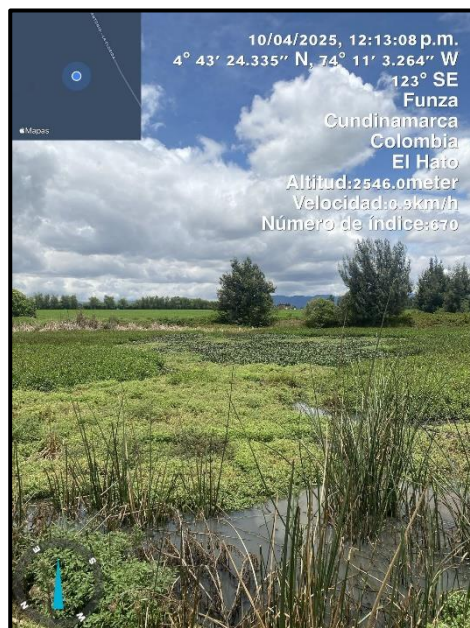
Ilustración 3. Evidencia recorrido punto 2